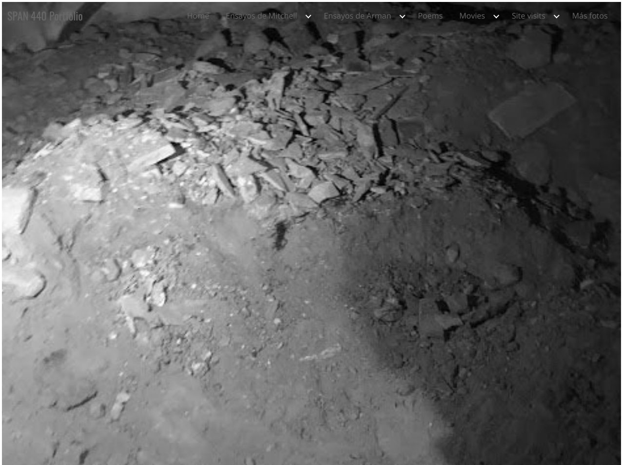
el único colapso durante la guerra, matando a dos niños.